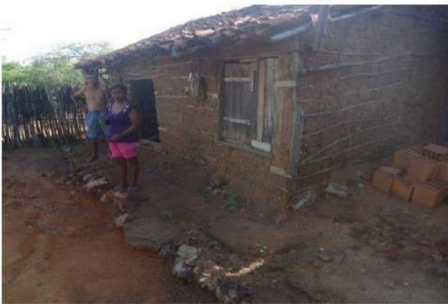
Beneficiário: Cicera Gilvanilda da Silva Localidade: Sítio Papamel

Casa 8 (24M) Latitude: 0477211 Longitude: 9149283